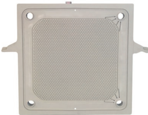
Membranplatte HERMETIX 800 P