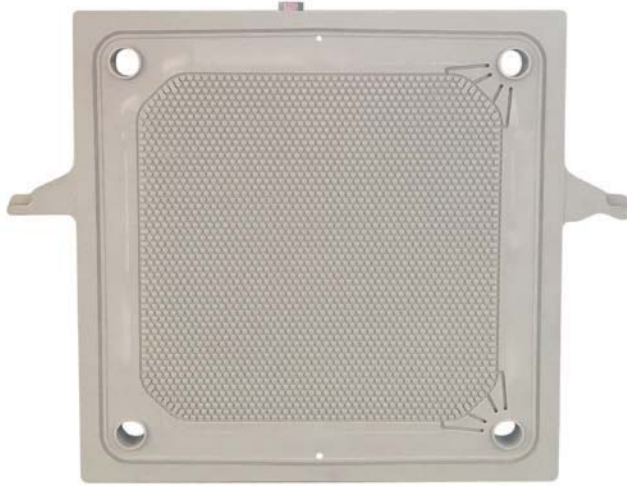
气囊板 HERMETIX 800 P